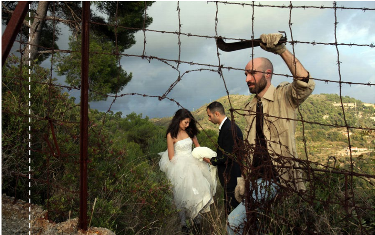
Gli sposi attraversano la frontiera tra Italia e Francia

Nelle ambasciate europee, il loro passaporto vale carta straccia. Così ogni mese, migliaia di siriani e palestinesi si affidano ai contrabbandieri libici ed egiziani, per attraversare il Mediterraneo su imbarcazioni di fortuna. Fuggono dalla guerra in Siria e vengono a chiedere asilo politico in Europa. L'Italia è solo un paese di transito, l'obiettivo è la Svezia. Dopo lo sbarco in Sicilia, il viaggio riprende da Milano, in macchina, di nuovo nelle mani dei contrabbandieri. Con le leggi sull'immigrazione in vigore, non c'è altra soluzione. A meno che a quelle leggi qualcuno non decida di disobbedire. Noi l'abbiamo fatto. E in questo film vi raccontiamo quello che ci è accaduto sulla strada da Milano a Stoccolma tra il 14 e il 18 novembre 2013.