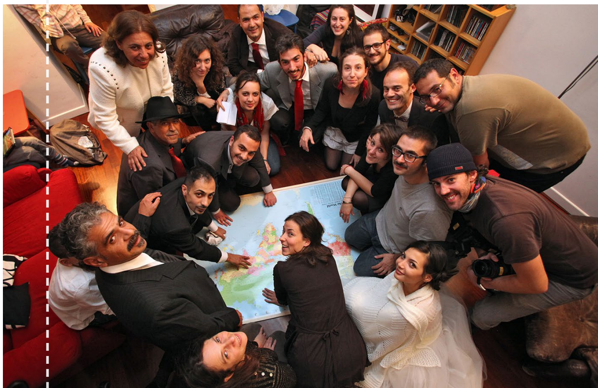
Il gruppo, la sera prima della partenza da Milano